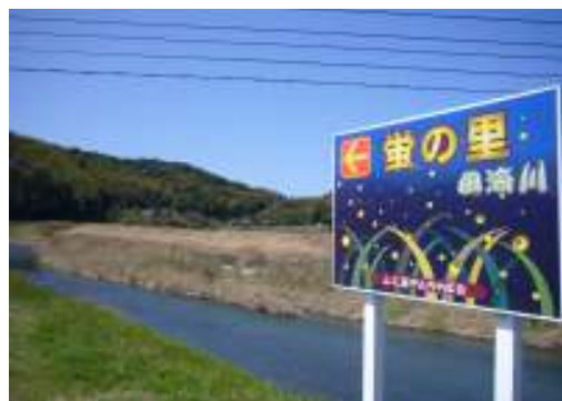
【田海町 上ノ原～東郷町】