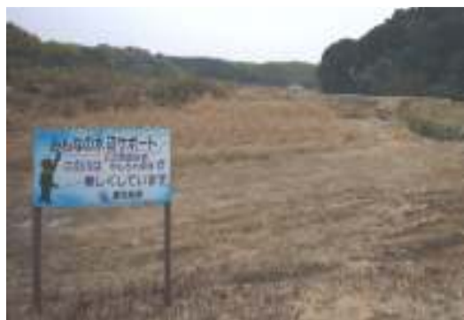
(田海川：堂坂イゼキ下流の除草)