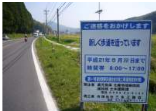
【田海町：八幡コミセン前】