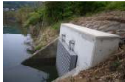
【川内地区～向田町 隈之城地区～宮崎町】