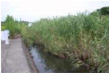
久見崎川の寄り洲除去、除草 <下流が見えなかった>