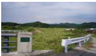
網津川の寄り洲除去、除草 <水面が全く見えなかった>