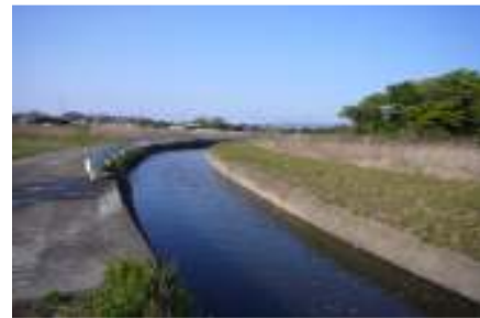
【滄浪地区～久見崎町】