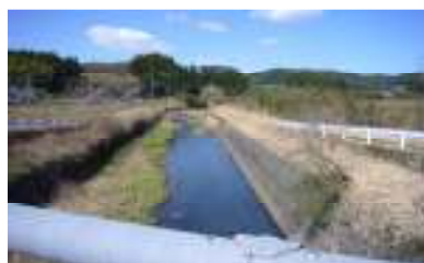
【隈之城地区～青山町 山仁田橋付近】