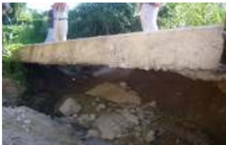
樋脇川の管理用道路のクズレ <路盤までえぐられていた>