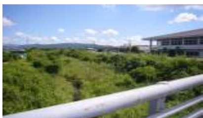
勝目川の除草・竹木の伐採 <水面が見えなかった>