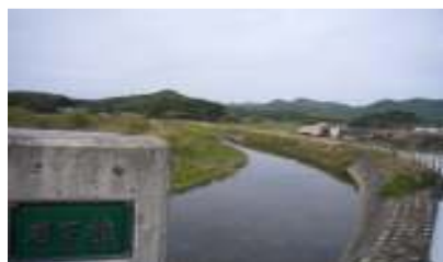
【水引地区～網津町 岩下橋付近】 (水が流れるようになりました)