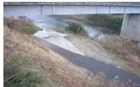
【平佐東地区～中村町 戸田橋付近】