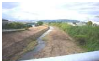
【隈之城地区～坪塚橋:セントピア付近】 (景観的にもきれいになりました)