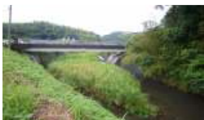
小倉川の寄り洲除去、除草