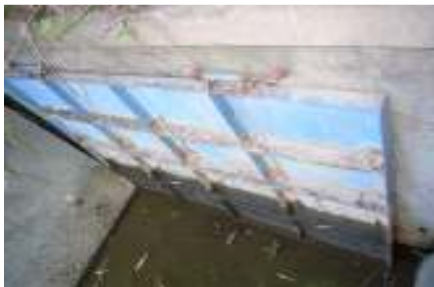
隈之城川の招き水門の取替え <古くて機能していなかった>