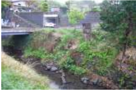
牟田川（八間川支流）のがけクズレ