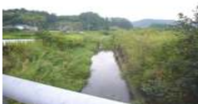
隈之城川の除草・竹木の伐採