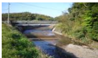
【水引地区～小倉町 出口橋付近】