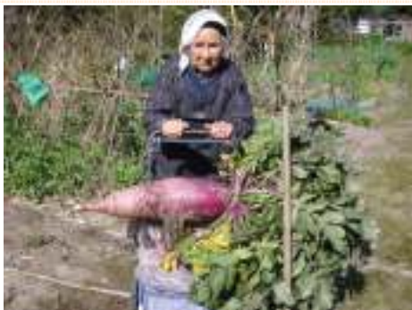
< 田中県議のお母さんの作品です。 >