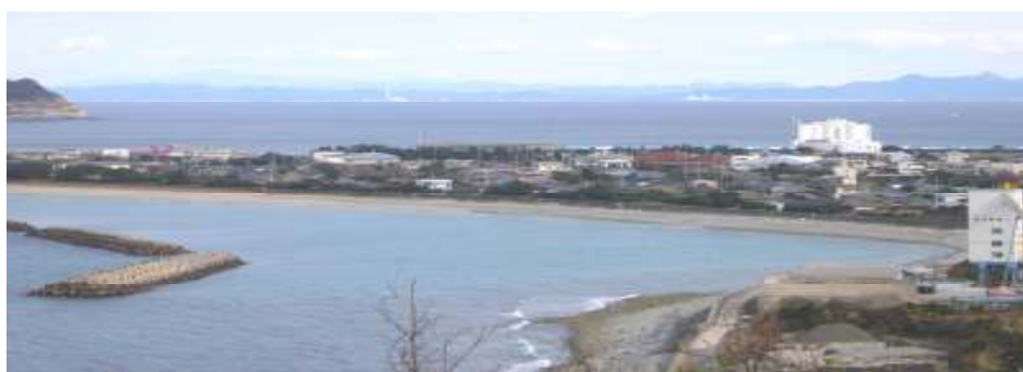
<里町から東へ、川内港方面の遠景>