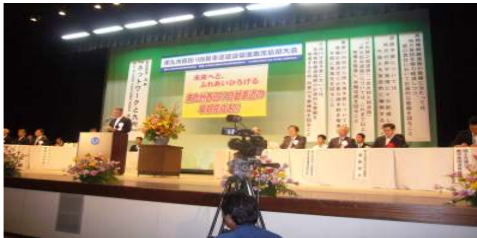
(H25.10.15 ～ 阿久根市)

薩摩川内都(隈之城)IC～高江ICはH26年度中に開通予定です。基本計画のままである「水引IC～阿久根間の早期事業化」に向けて関係者700名の決起大会が開催されました。