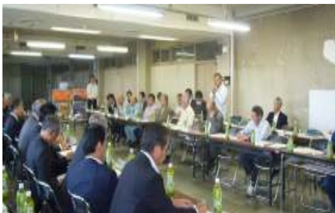
（出水市で商工団体等との意見交換会）

肥薩おれんじ鉄道活性化議員連盟の事務局長として、県議連、沿線3市議会議連と連携し、合同研修会、意見交換会、本省への要望活動に奔走しています。