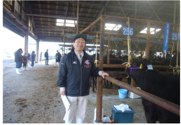
(地方創生の原点 ～ 一次産業の振興を)