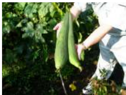
<八幡地区(田海町)でとれた、ヘチマの双子です>